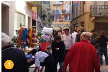
1 Nucleo Storico