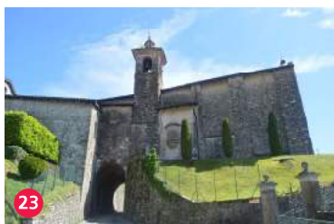
23 Chiesa di San Sisino