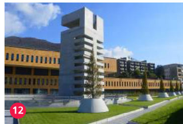
12 Centro Pronto Intervento, Arch. Mario Botta