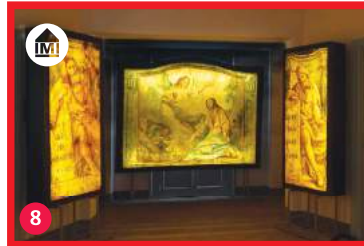
8 Museo del trasparente museo.mendrisio.ch