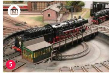
5 Galleria Baumgartner galleriabaumgartner.ch