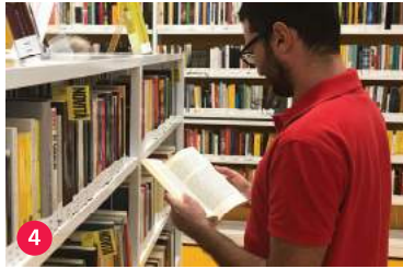
4 La filanda lafilanda.ch