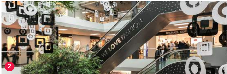
2 FoxTown Factory Stores - Infopoint Mendrisiotta Turismo foxtown.com