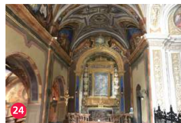
24 Chiesa di Santa Maria in Borgo