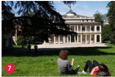
7 Villa Argentina e parco botanico