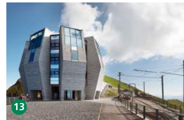
13 Fiore di pietra, Arch. Mario Botta montegeneroso.ch