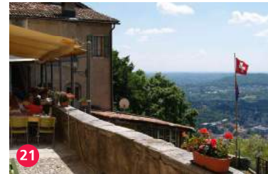
21 Eremo di San Nicolao