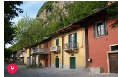
9 Cantine di Mendrisio