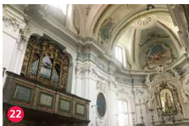
22 Chiesa di San Giovanni