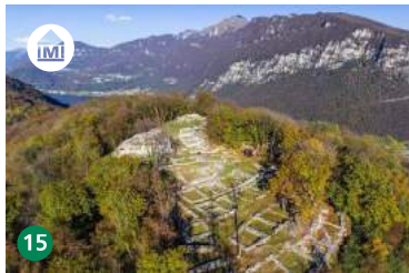
15 Parco archeologico Tremona parco-archeologico.ch