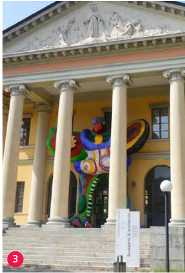
3 Accademia di Architettura arc.usi.ch