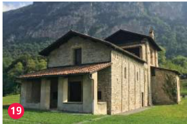
19 Chiesa di San Martino