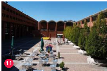
11 Piazzale alla Valle, Arch. Mario Botta