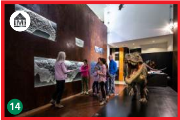
14 Monte San Giorgio, Arch. Mario Botta montesangiorgio.org