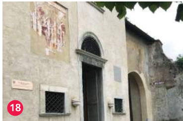
18 Oratorio della Madonna delle Grazie