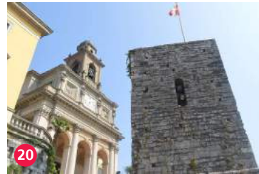
20 Chiesa dei Santi Cosma e Damiano