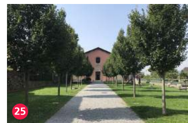
25 Chiesa dei Cappuccini

8: Processioni della Settimana Santa di Mendrisio, Representative List of the Intangible Cultural Heritage of Humanity (UNESCO) 14: Monte San Giorgio UNESCO WHL