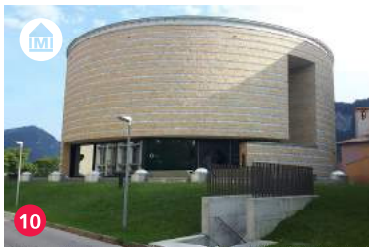
10 Teatro dell'architettura, Arch. Mario Botta