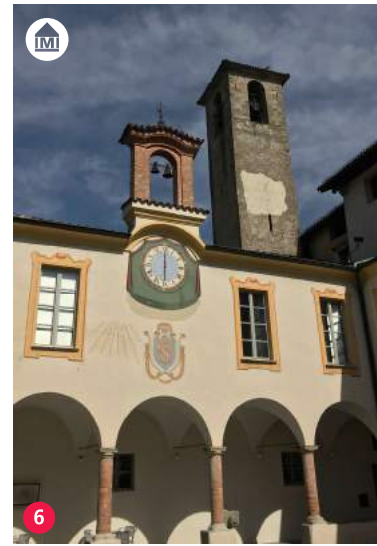
6 Museo d'arte Mendrisio museo.mendrisio.ch