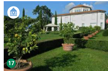
17 Museo Vincenzo Vela Ligornetto museo-vela.ch