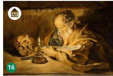
16 Pinacoteca Züst Rancate ti.ch/zuest