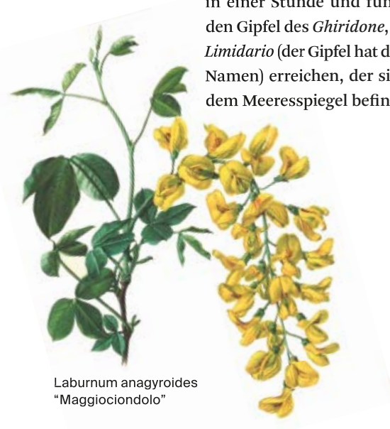
Laburnum anagyroides "Maggiociondolo"

Zwischen 1992 und 1995 erbaut und am 19. August 1995 eingeweiht, ist dieses kleine Juwel auf 1802 Metern Höhe in etwa einer Stunde und vierzig Minuten entweder von Mergugno oder von Cortaccio aus zu erreichen. Es gibt einen Höhenunterschied von etwa 800 Metern zu überwinden. Oben angekommen, hat man einen traumhaften Ausblick auf dem See und die Berge. Die Hütte ist das ganze Jahr offen und wird in den wärmeren Monaten (etwa von März bis Oktober) von einem oder mehreren Hüttenwirten bewirtschaftet. Von der Hütte aus kann man in einer Stunde und fünfzehn Minuten den Gipfel des Ghiridone , Gridone oder Monte Limidario (der Gipfel hat drei verschiedene Namen) erreichen, der sich auf 2188 m über dem Meeresspiegel befindet.