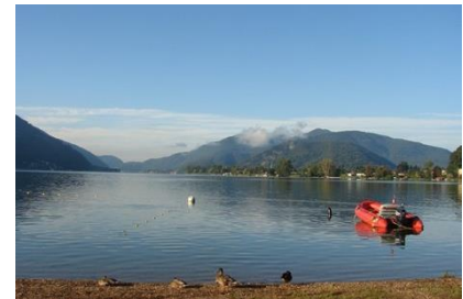
Golfo di Agno (SUI).