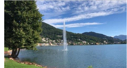
Golfo di Lavena-Ponte Tresa (ITA)