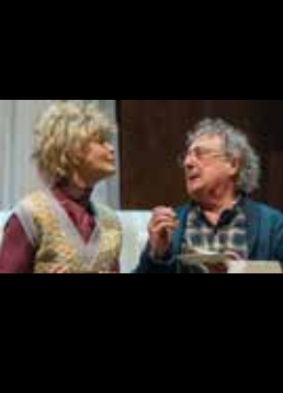
Enzo Iacchetti e Vittoria Belvedere in un'immagine tratta dal film "L'Instant Theatre"