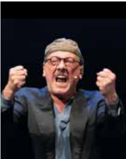
Sergio Castellitto in un'immagine tratta dal film "L'Instant Theatre"