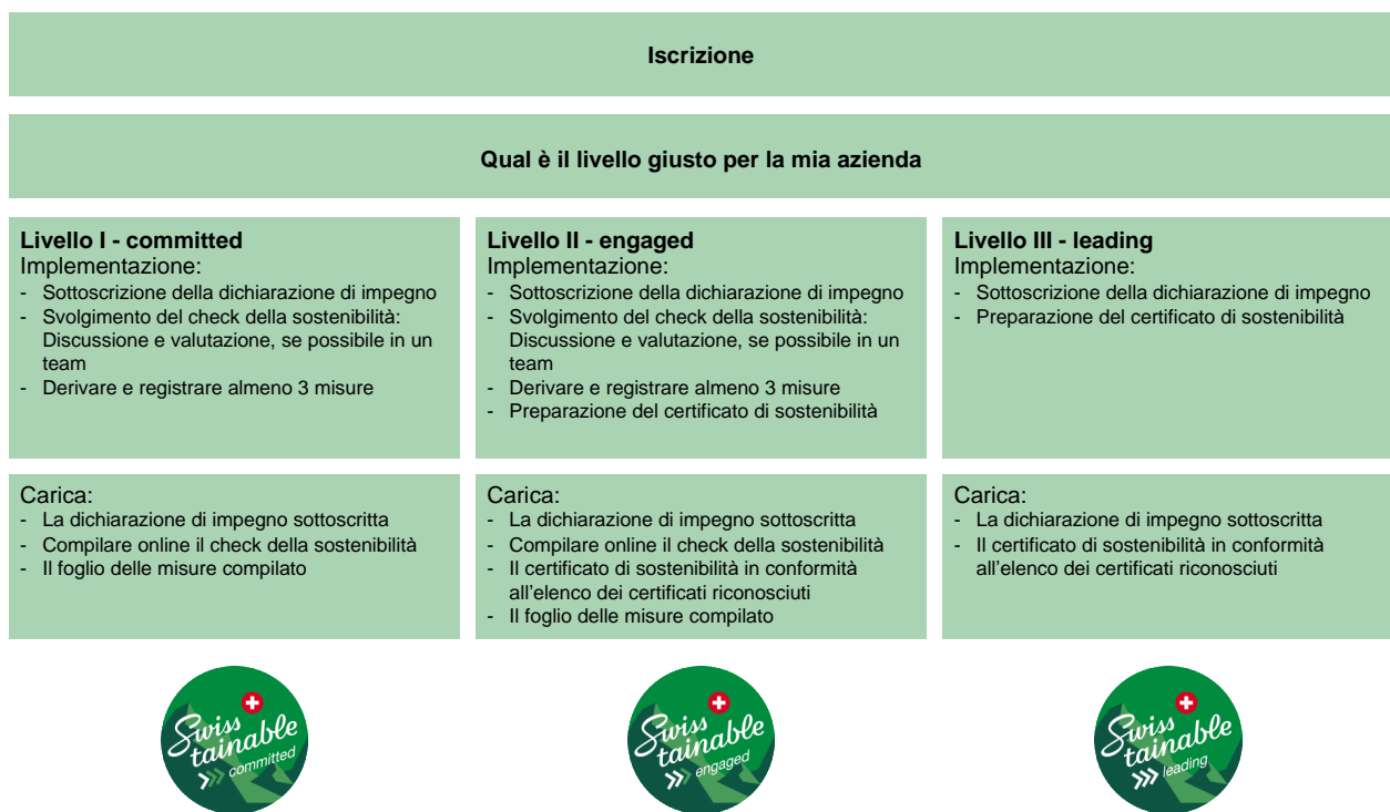
Figura 4: panoramica della procedura per ogni livello

La figura fornisce una panoramica delle fasi dell'attuazione e dei certificati richiesti. Le fasi concrete della procedura di attuazione sono descritte di seguito, suddivise in base al livello.